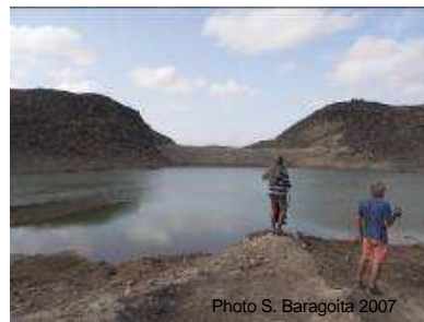
Digue en pierre maçonnée