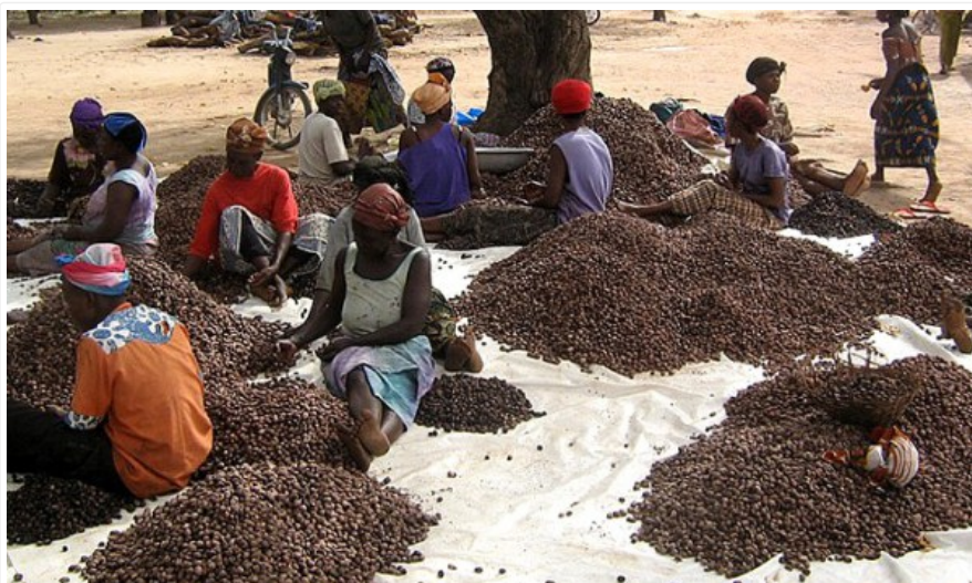
Collecte de noix de karité

Le Burkina va bénéficier d'une enveloppe de 1,2 milliard de F CFA, un peu plus de 2 millions de dollars Us, de la part de la Banque Africaine de développement. Cette enveloppe répartie en deux servira à appuyer les secteurs de l'agriculture et de l'hydraulique du pays.